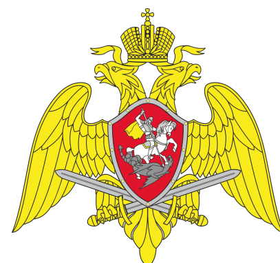
Федеральная служба войск национальной гвардии РФ (Росгвардия)