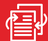
АО «Российский сельскохозяйственный банк»