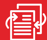
АО «Российский сельскохозяйственный банк»