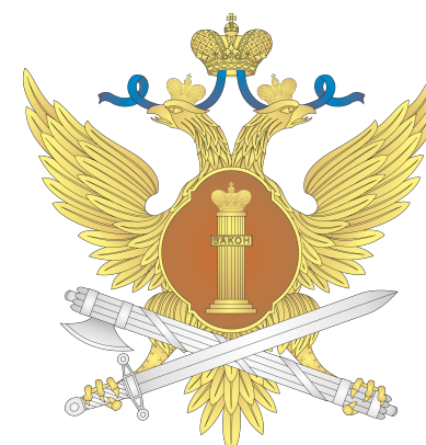
Федеральная служба исполнения наказаний РФ (ФСИН России)