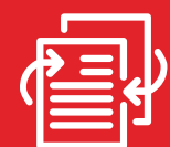
АО «Российский сельскохозяйственный банк»